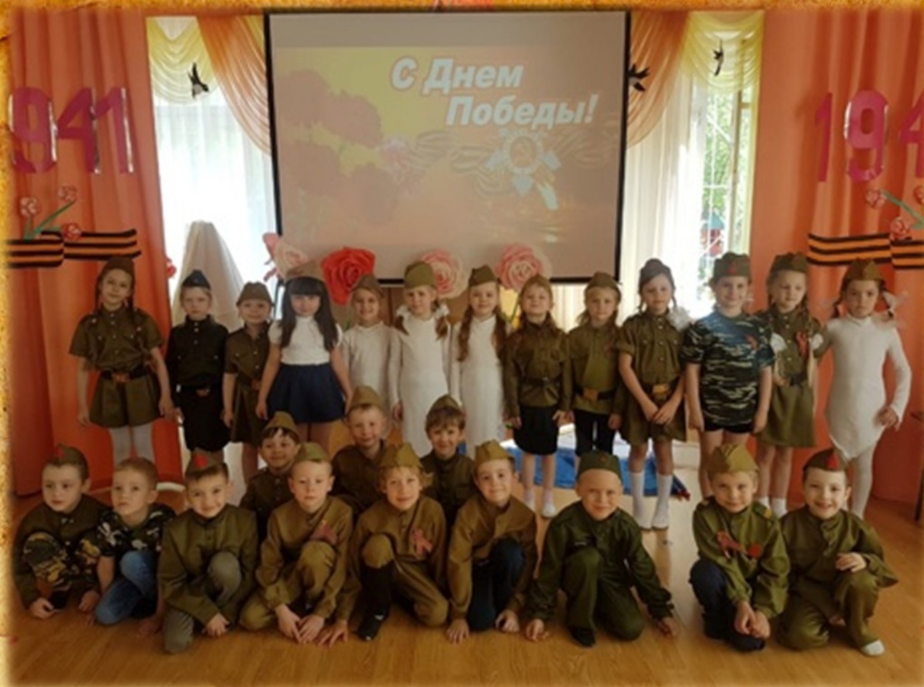
Концерт посвященный песням военных лет