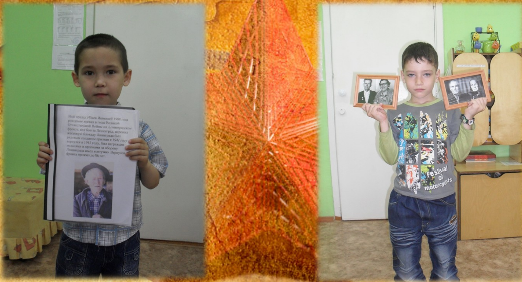
Сообщения детей о родственниках воевавших в годы ВОВ