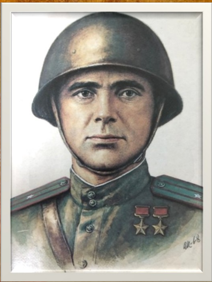
Рассматривание иллюстраций Герои войны